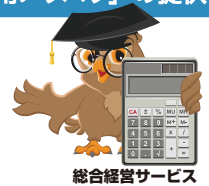
総合経営サービス

お客様への関与の仕方はそれぞれ異なるかと思われます。 お客様との契約形態に応じたご提案のヒントを提供します。 ※「書式集」でのお渡しになります。